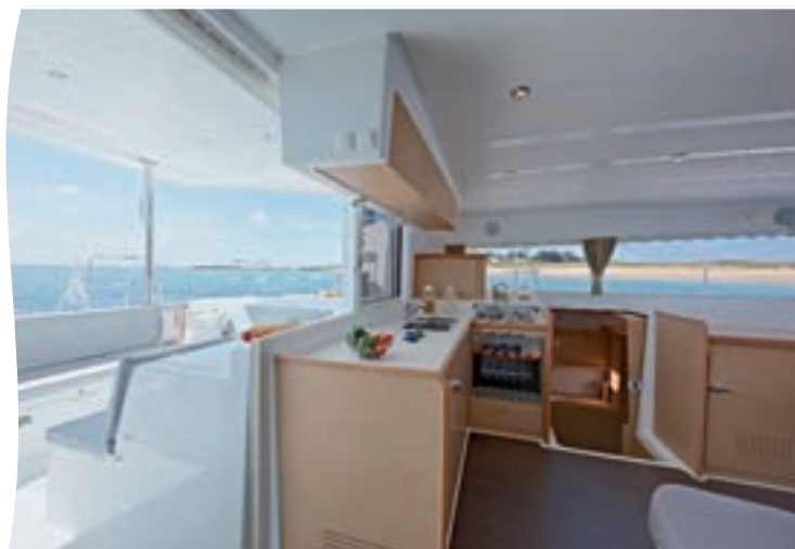
La cuisine, orientée vers l'arrière, communique avec le cockpit. On a quasiment l'impression de préparer les plats à l'extérieur... et toujours à plat !