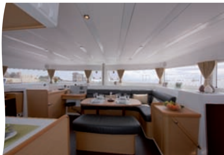
La nacelle profite d'un éclairage généreux grâce aux grands hublots. Ceux-ci sont verticaux et protégés par la casquette du roof afin de réduire au maximum l'effet de serre.