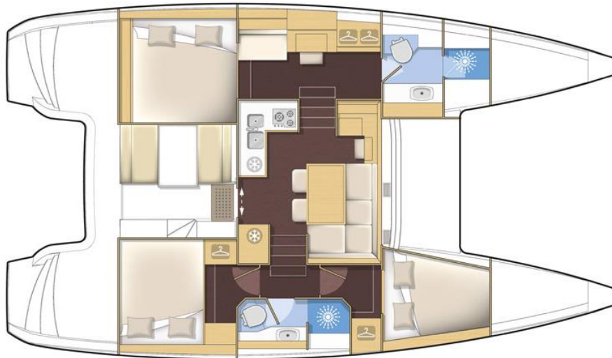
version premium 3 cabines / 3 cabin premium version