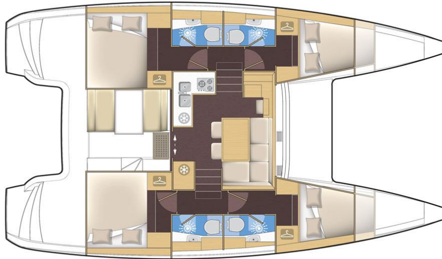
version premium 4 cabines 4 sdb - 4 cabin 4 head premium version