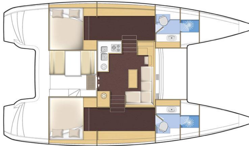
version standard 2 cabines / 2 cabin standard version