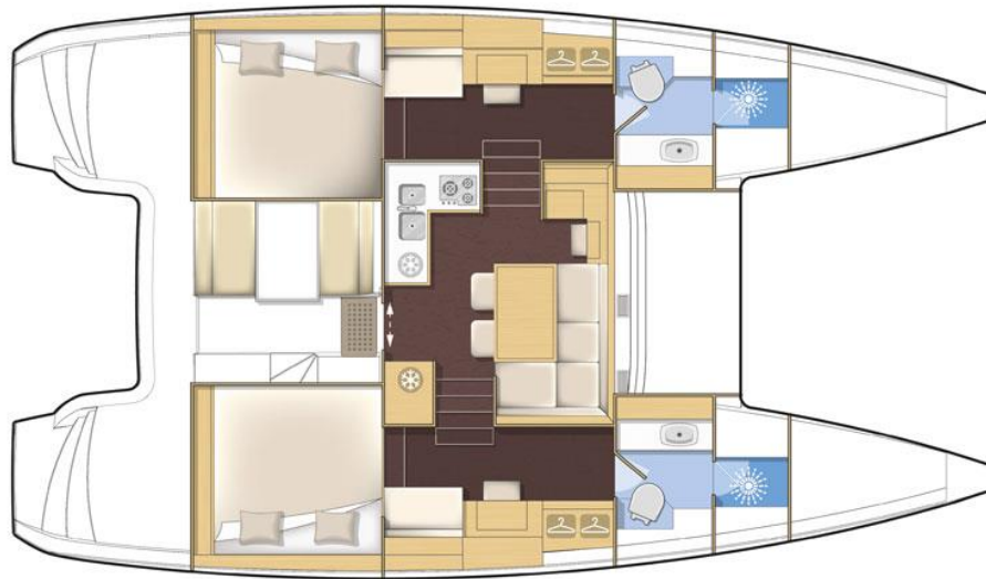
version premium 2 cabines / 2 cabin premium version